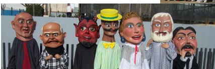
Capgrossos de Sant Vicenç de Montalt