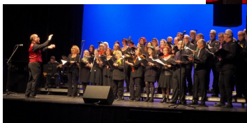
Cor de projectes