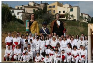
Colla de geganters de Sant Vicenç de Montalt